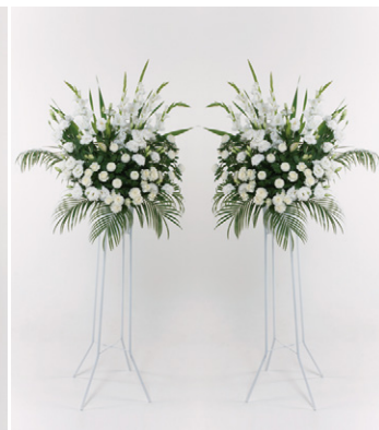
供花 30 (二基一対) 30,000円 (税抜)