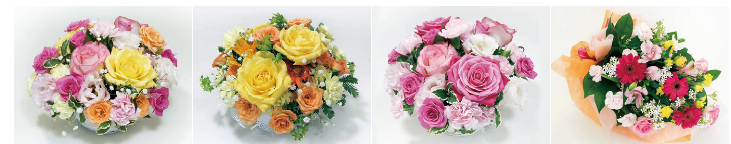
アレンジメント (色ミックス系)

電報と一緒に、季節のお花を提携生花店からお届けいたします。 「色合い」「シーン」「イメージ」など、ご指定のキーワードにあわせてアレンジいたします。