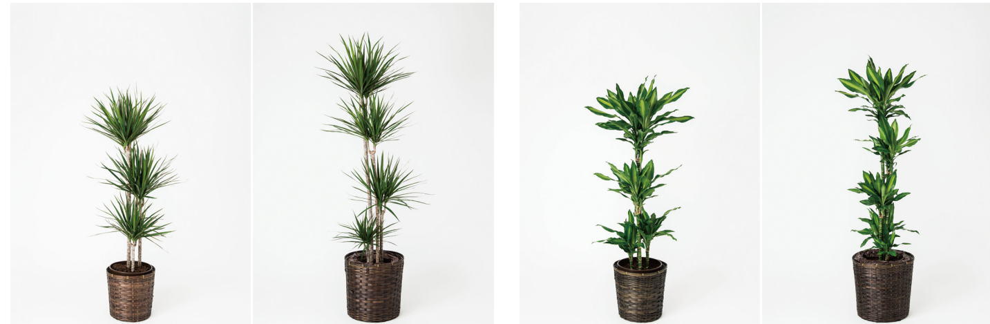
コンシンネ(8号) 11,000円(税抜)