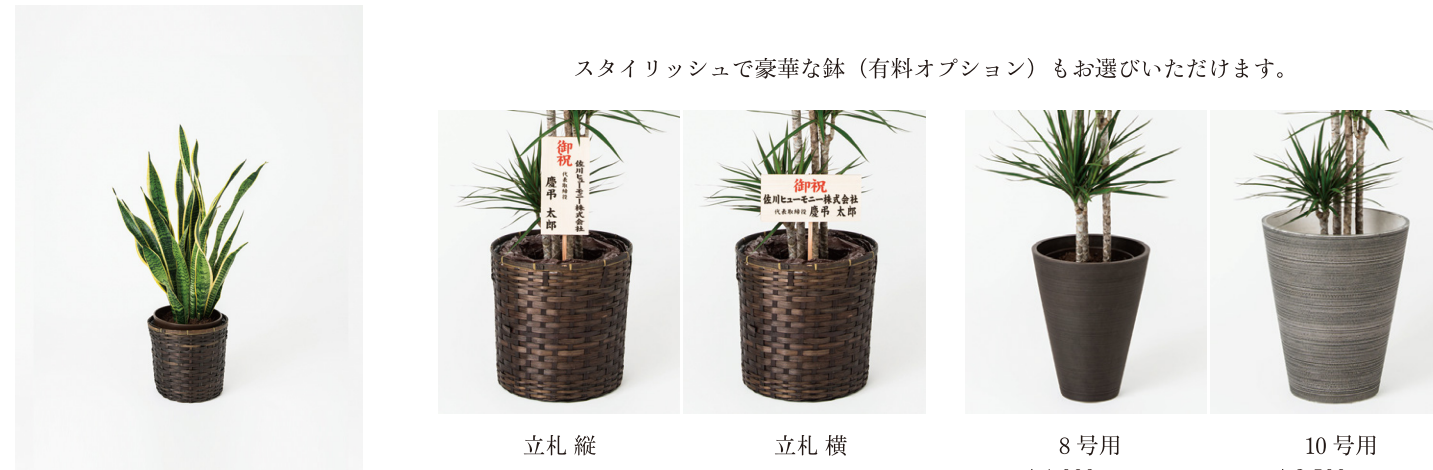
サンセベリア(8号) 11,000円(税抜)