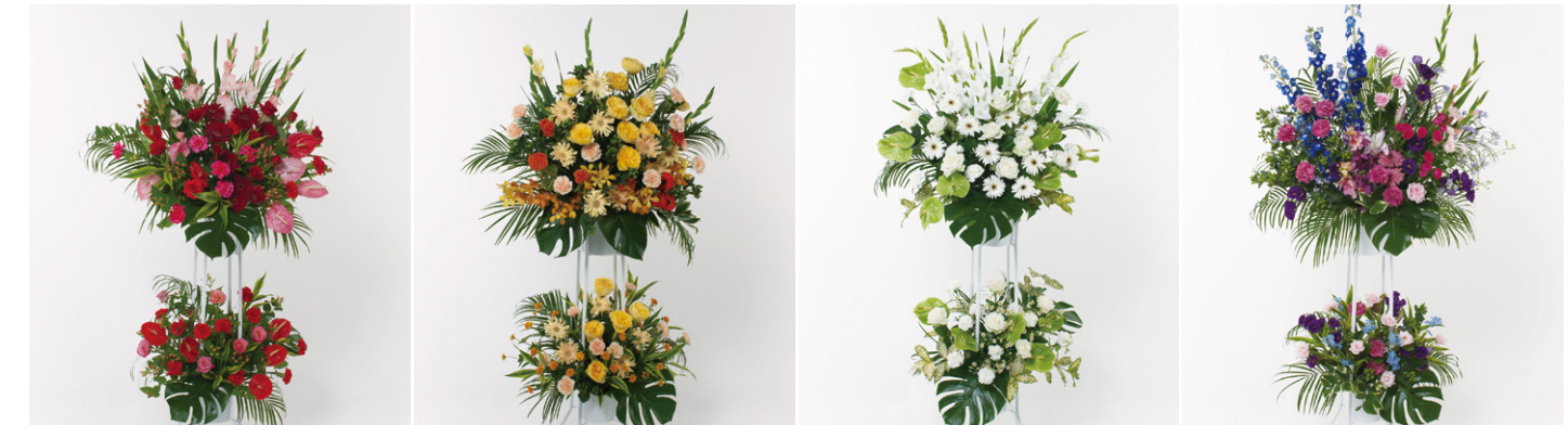
スタンド花 20(赤・ピンク系) 18,000円(税抜)