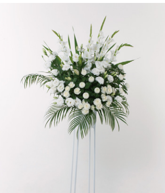
供花 15 (一基) 15,000円 (税抜)

お客様に代わって葬儀社・斎場へ花の仕様・設置時間などの確認を当社が行います。 葬儀社・斎場への電話やFAXなどの手間が大幅に省け、業務の効率化につながります。