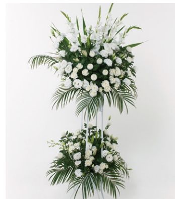
供花 20 (一基) 20,000円 (税抜)