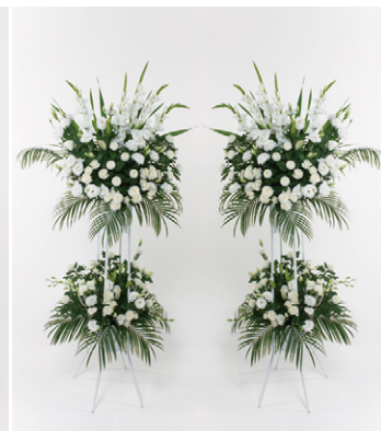
供花 40 (二基一対) 40,000円 (税抜)