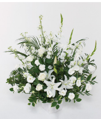
籠花 15 (一基) 15,000円 (税抜)