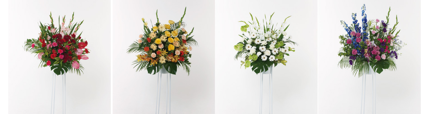
スタンド花 15(赤・ピンク系) 13,500円(税抜)

用途や地域の風習等、お届け先の仕様に合わせたお花を提携生花店からお届けいたします。 地域や季節によって花材・花器は異なります。 法人会員様は通常価格(15,000円・20,000円)より10%割引でご利用いただけます。