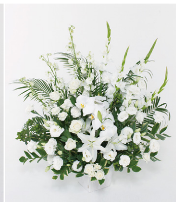
籠花 20 (一基) 20,000円 (税抜)

生花専門のオペレーターが葬儀社・斎場に詳細を確認後、地域の風習やお届け先にあわせた最適なものを手配いたしますので、地域や季節によって花材・花器は異なります。